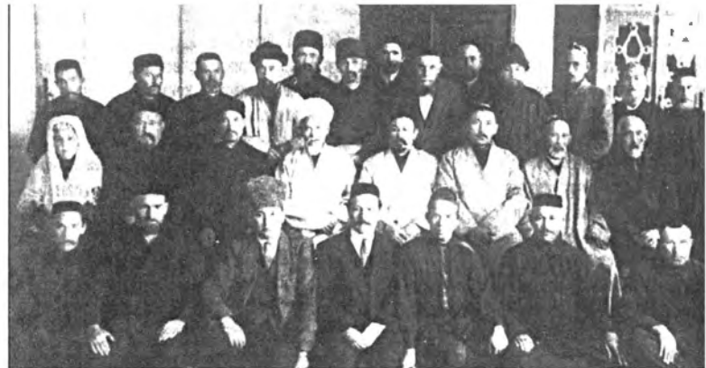
Сотрудники ЦДУМ, г.Уфа, 1926 г.

Но мусульманское духовенство не собиралось сдавать свои позиции. В октябре-ноябре 1926 г. состоялся съезд духовенства в Уфе, который выступил с предложением расширения прав в области вероучения. Несмотря на внешнюю лояльность руководства ЦДУМ, было ясно, что его не устраивала политика советского государства. Тем более за этой организацией стояла довольно мощная сила: в 1927 г. ЦДУМ объединял 14825 приходов,