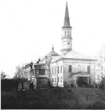
أحد عتباته الدينية حيدرآباد، تراق ولاية أوردو، الهند البريطانية، ميوزا سونرمانس سوقی طرحیدن ۱۸۳۰ بجای ستاره یا ایستادن.