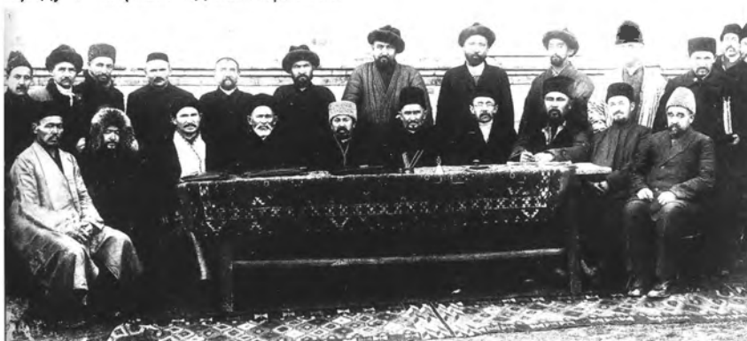
Всесоюзный съезд мусульманского духовенства в г.Уфе, 1927 г.

К концу 1920-гг. эффективным механизмом стало резкое повышение налогообложения духовенства, сопровождавшееся лишением избирательных прав.