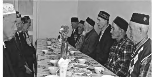
Встреча с ветеранами г. Самара