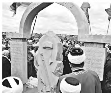
Булгары. Памятник трем сахабам

стали их подданными. Потом они (татары) смешались и породнились с ними (кыпчаками) и земля одержала верх над природными и расовыми качествами их (татар), и все они стали точно кыпчаки, как будто они одного (с ними) рода; оттого, что монголы поселились на земле кыпчаков, вступили в брак с ними и остались жить на земле их". Таким образом, монголы и пришедшие с ними представители разных покорённых народов, происходившие, в основном, из кочевой среды, уже к середине XIV века растворились среди покорённого населения Дешт-и Кипчака. Как отмечал Ф.Энгельс в "Анти-Дюринге": "...в огромном большинстве случаев при прочих завоеваниях дикий победитель принуждён был приравниваться к тому высшему "эко-