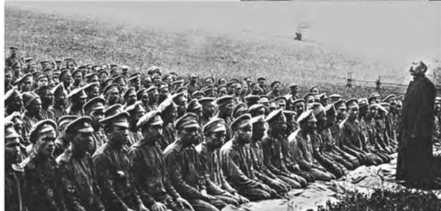
Призыв муллы к защите Отечества, 1914 г.

защитными назначается из числа священнослужителей традиционных религиозных объединений Российской Федерации. В богослужбной деятельности он руководствуется внутрицерковными установлениями. Имеет право хранить и использовать соответствующие предметы культа», – говорится в приказе. В служебных обязанностях помощника командира бригады по работе с верующими