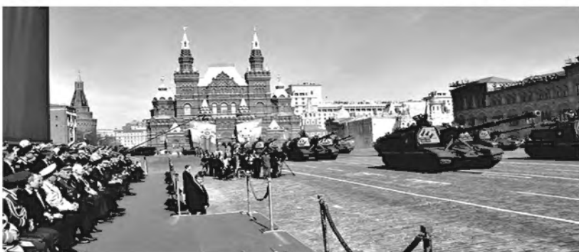
По приглашению Президента Российской Федерации Владимира Владимировича Путина Верховный муфтий Талгат Таджуддин был на параде на Красной площади в Москве и принял участие в торжественном приеме в Кремле по случаю 68-ой годовщины Победы в Великой Отечественной войне.