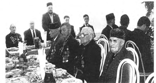
Встреча с ветеранами в День Победы (Республика Башкортостан, Балтачевский район, с. Балтачево)